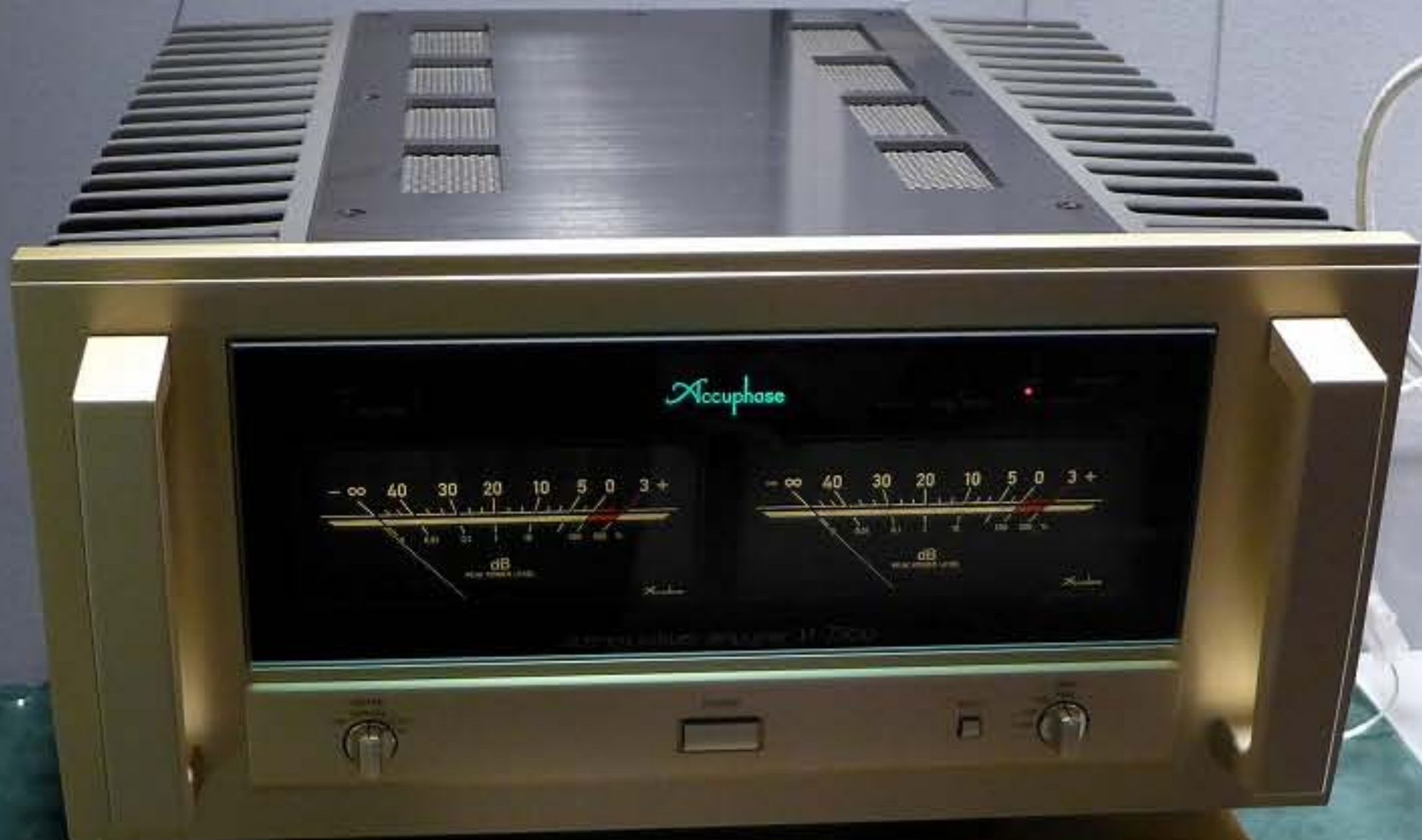
NI P-7300 STEREO POWER AMPLIFIER ステレオパワーアンプ 定価 1,200,000円(税別) 発売日 2015年12月中旬