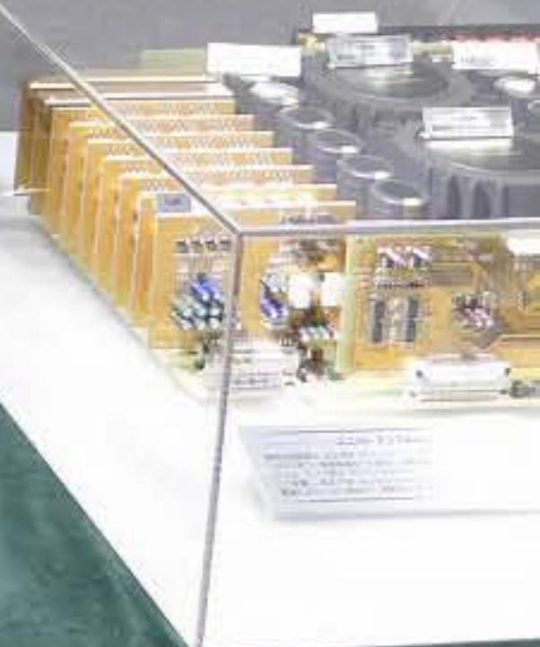
NIWA P-7300 STEREO POWER AMPLIFIER ステレオ・パワー・アンプ ● 定価 1,200,000円(税別) ● 発売時期 2015年12月中旬